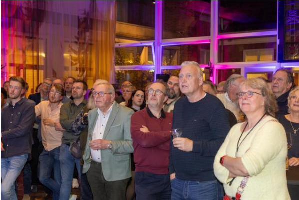
Ingespannen kijken naar de uitslagen van de stembureaus in Hoogeveen.

Het politieke landschap in de gemeente Hoogeveen is na de verkiezingen flink opgeschud. Gemeentebelangen wint een zetel en blijft de grootste partij. Forum voor Democratie is de grootste winnaar, gevolgd door de VVD. Voor GroenLinks-PvdA en het CDA zijn de druiven zuur.