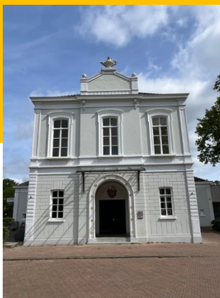
De Concertzaal in Oosterbeek. Na de zomer vergadert hier de raad van Renkum